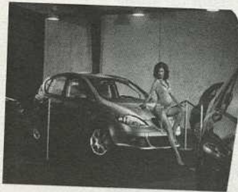
SEAT Altea. Finally a family sports car.